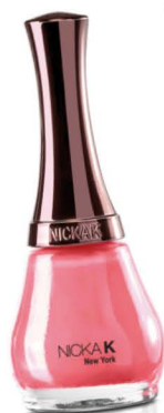
NICKAK. Mijn favoriete nagellak. De verschillende kleuren zijn stuk voor stuk mooi en niet geheel onbelangrijk: de lak is gemakkelijk aan te brengen en blijft dagenlang mooi zitten.