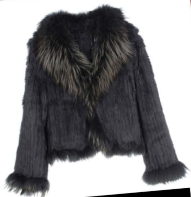
Om er deze winter lekker warmpjes bij te zitten, dit heerlijke bontjasje van Gotta-haves. www.gotta-haves.com