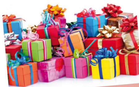
Cadeautjes. In december worden wereldwijd vele cadeautjes gekocht en gegeven. Mijn grootste en mooiste cadeau is de feestdagen doorbrengen met familie en vrienden.