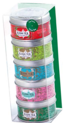
Heerlijke Kusmi tea, de lekkerste theesoorten ter wereld! Wat ben ik fan van deze verschillende groene theesoorten. Leuk verpakt, dus ook voor de feestdagen en leuk cadeau om te geven en te krijgen.