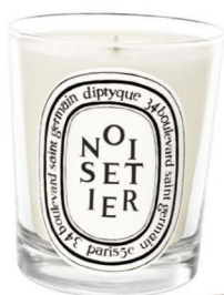
Met de exclusieve Diptyque kaarsen creëer je in ieder huis een thuisgevoel. €61,-.